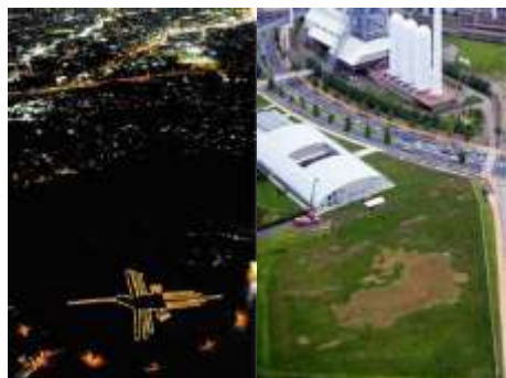
世界最大の世界地図を描く (日本建築学会大会関連行事)