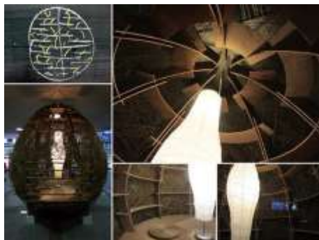
一坪の茶室を建てる (国立青少年教育振興機構委託研究)