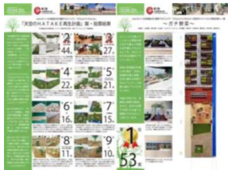
天空のHATAKE再生計画 (cross fm/野村不動産協働研究)