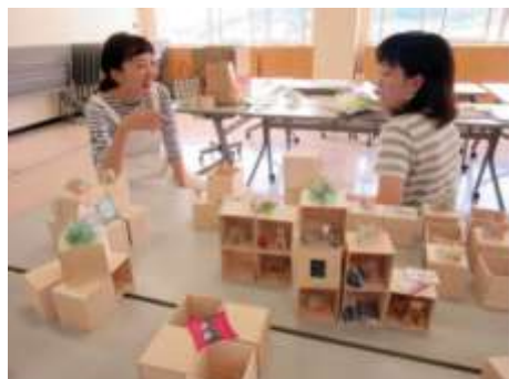
立方体の箱の構成による展示装置 (日本学術振興会委託研究)